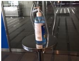
入口にアルコール消毒液を設置