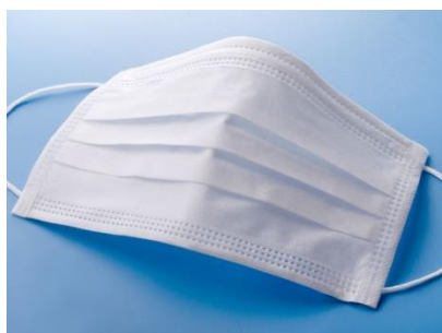
マスク着用でのご来館