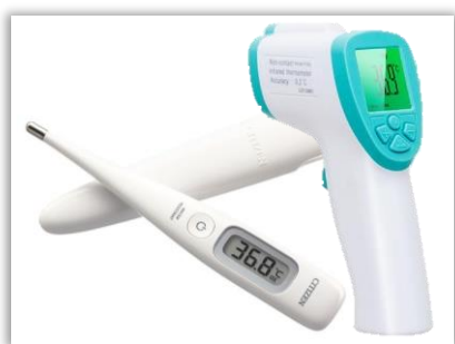
ご来館前の検温で体調ご確認