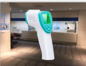
電子温度計の貸し出し