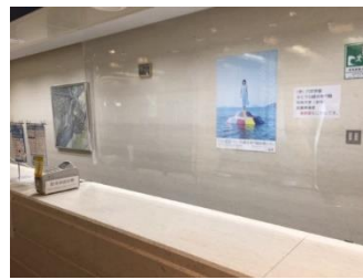
受付の飛沫感染防止のカーテン