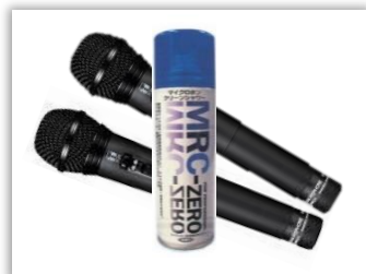
マイク専用除菌消臭スプレー