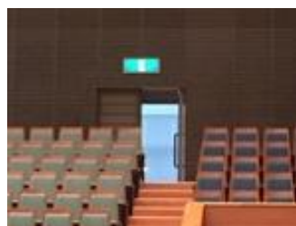
ホールもドアを開放