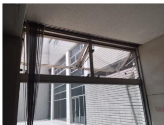
廊下の排煙窓を常時開放