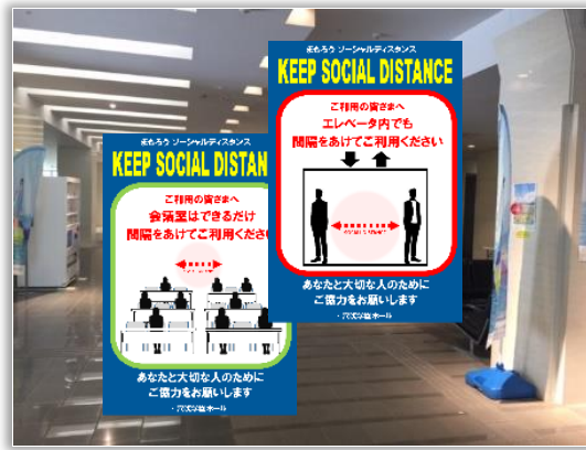
ソーシャルディスタンスの注意喚起